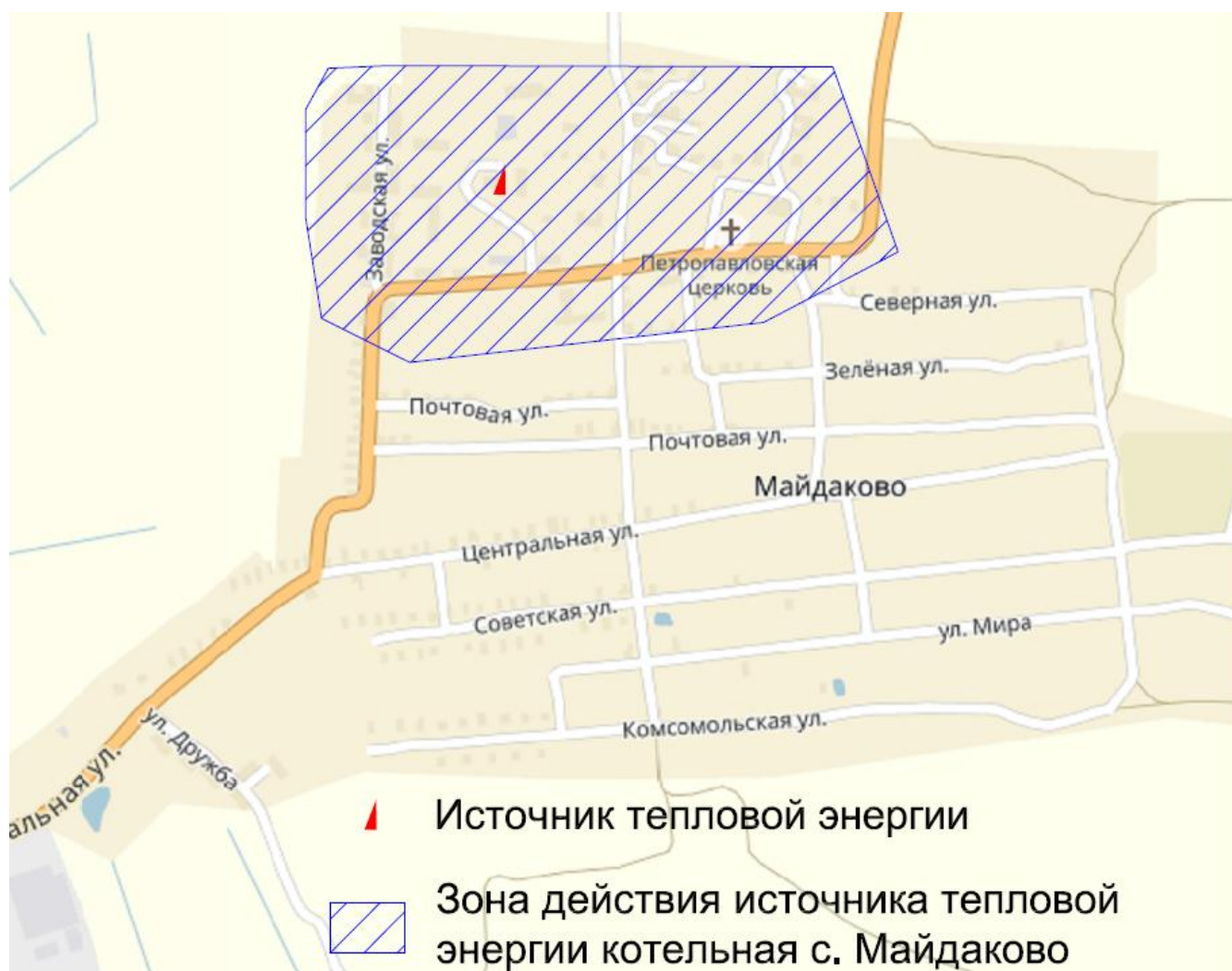
Рис. 2.2.1. Зона действия источника тепловой энергии с. Майдаково Майдаковского сельского поселения.